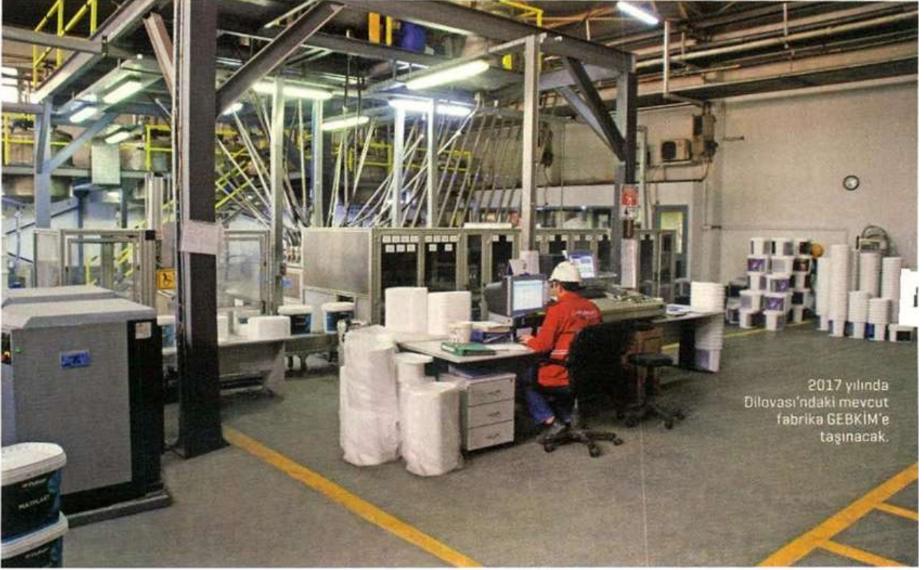
2017 yılında Dilovası'ndaki mevcut fabrika GEBKİM'e taşınacak.

mevcut fabrikaya 7-8 km uzaklıkta. Yeni fabrika ile belirlenen üç hedef var. Bunlardan ilki daralan kapasitenin büyümesi üzerine. Mizrahi, "Bizim Dilovası'ndaki mevcut fabrikamız ilk kurulduğunda kapasitesi 10 bin tondur. Aynı yıl toplam 4 bin ton üretim yapmıştık. Bugün ise ayda 13-14 bin ton üretim yapıyoruz. Dolayısıyla böyle bir yatırım gerekiyordu" diyor. İkinci hedef otomasyon ve verimlilik üzerine. Son hedefte ise eski fabrikayı kapatıp yerine liman yapmak yer alıyor.